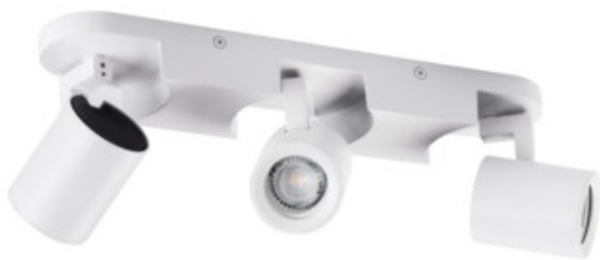
LAURIN EL-3I W