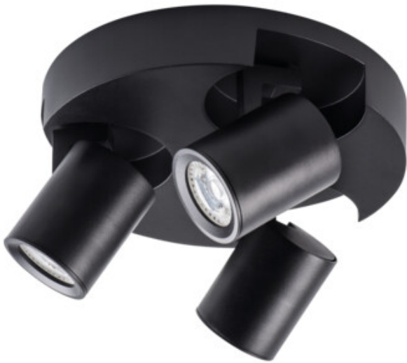
LAURIN EL-30 B