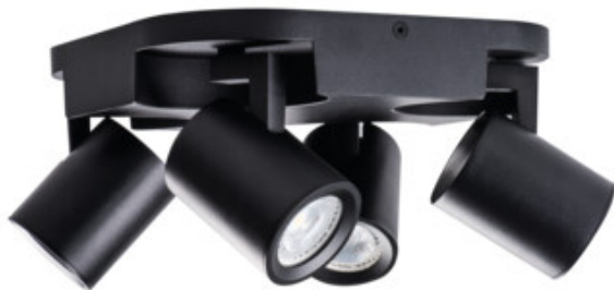
LAURIN EL-4O B