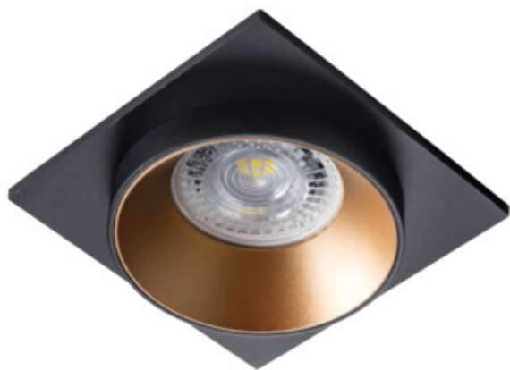
SIMEN DSL B/G/B