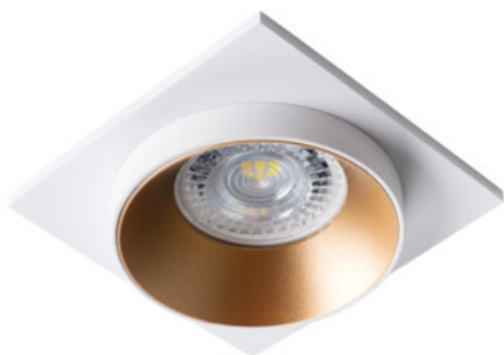
SIMEN DSL W/G/W