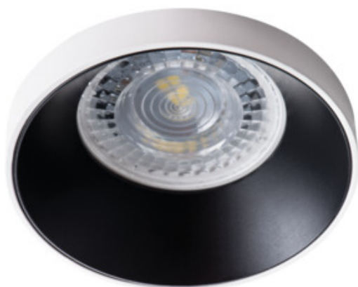
SIMEN DSO W/B