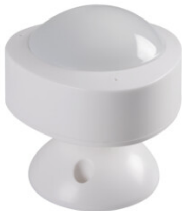
S SENSOR PIR INT 10M