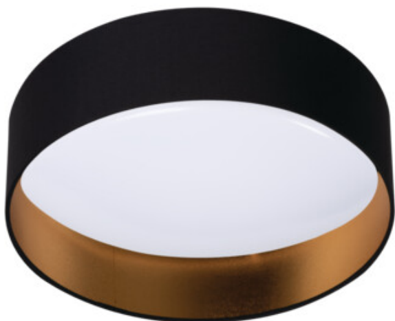
RIFA LED 17,5W B/G