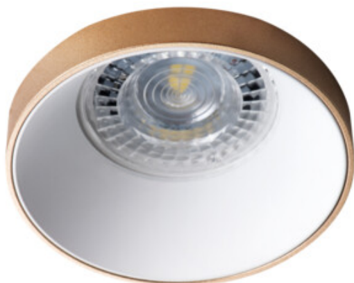
SIMEN DSO G/W