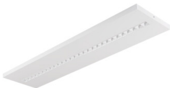
OS RST W N3