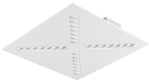
OSD RX B P1