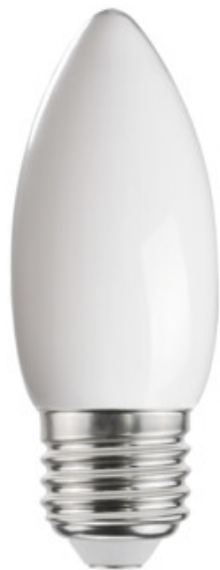
XLED C35E27 6W