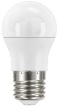
IQ-LED G45E27 7,2W