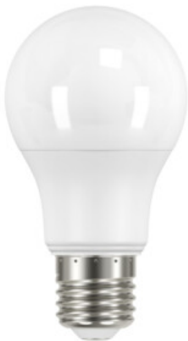
IQ-LEDDIM A60 7,3W